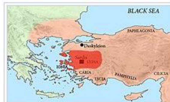
Lydia, including Ionia, during the Achaemenid Empire.