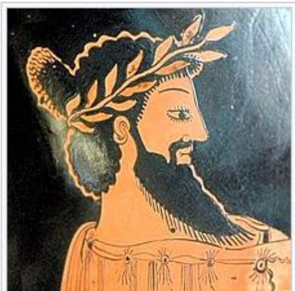
Portrait of Croesus, last King of Lydia, Attic red-figure amphora, painted ca. 500–490 BC.